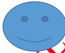
شکل (۱-۱) نمونه شکل

نمونه‌ای از شکل، نمودار و جدول نیز در ادامه طراحی شده است: